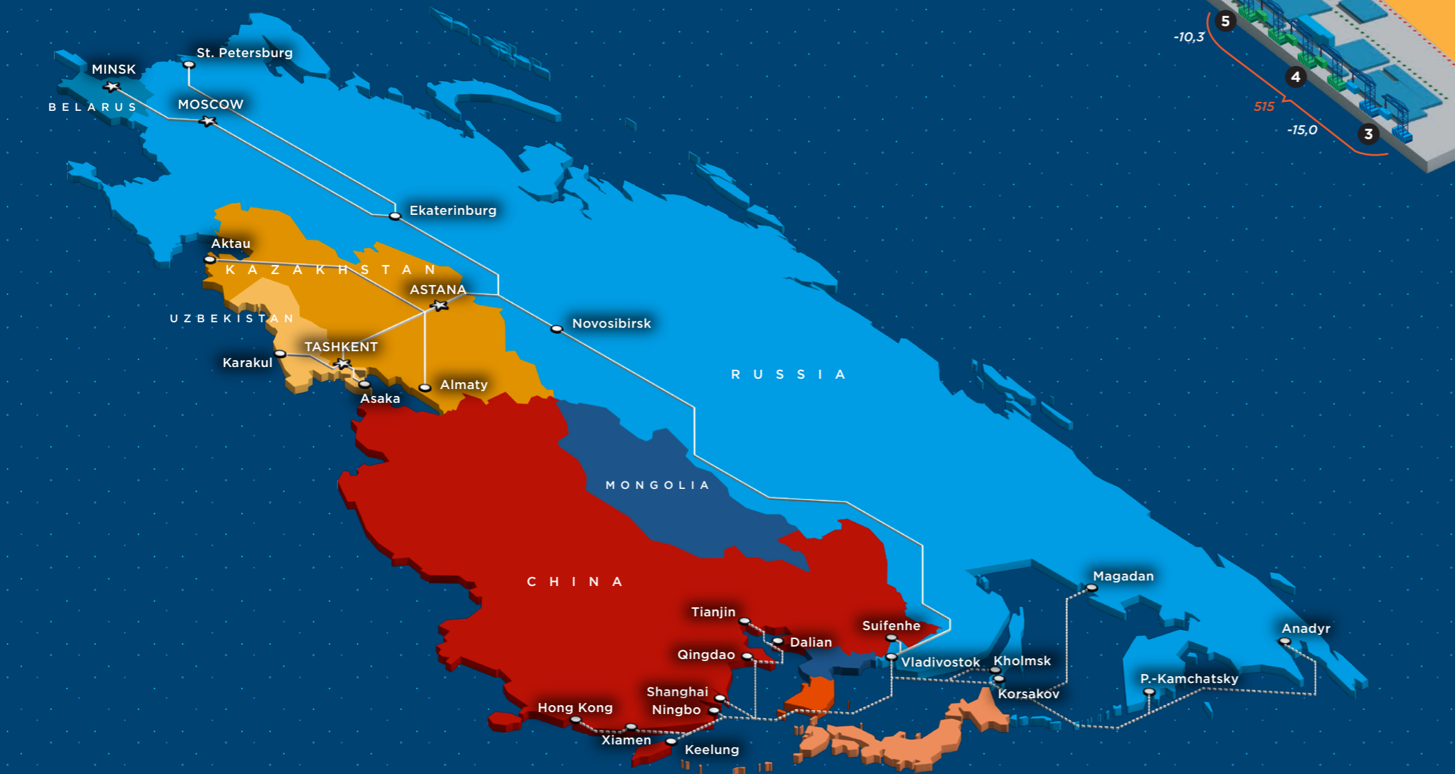
集装箱铁运线路示意图